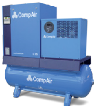
Vollständige Airstation mit Kompressor, Trockner und Druckluftbehälter