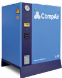
Kompressor auf Grundrahmen