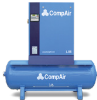
Kompressor auf Druckluftbehälter