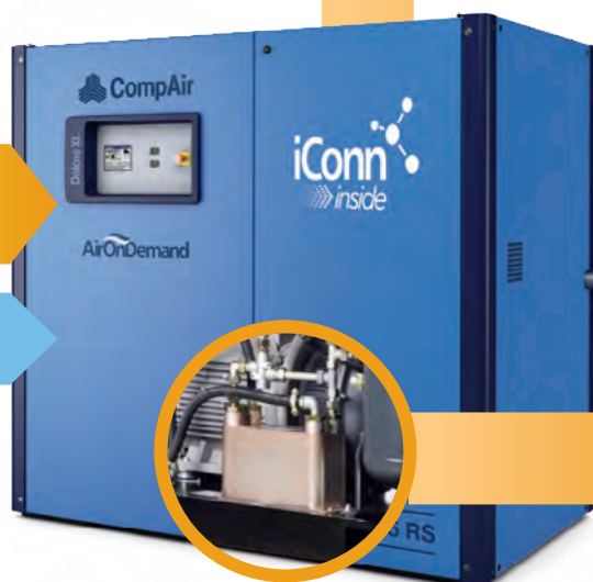
Wymiennik ciepła olej-woda