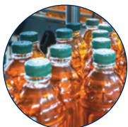
Lebensmittel- und Getränke