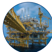
Öl und Gas