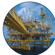
Öl und Gas