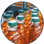
Lebensmittel- und Getränke