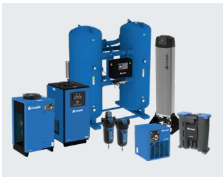
Drucklufttrocknung und -filtration Kondensatableitung, Stickstoffherzeugung