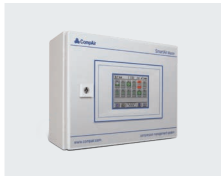
Druckluftmanagement Übergeordnete Steuerungen zur Steigerung der Systemeffizienz mit Fernwartung und Webserver