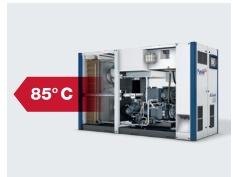
Wärmerückgewinnung Integrierte, ab Werk montierte oder nachrüstbare Wärmerückgewinnungs-Systeme